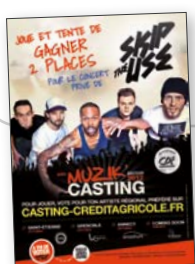
Concert Musik Casting