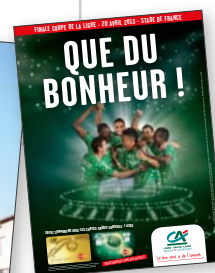
Partenaire officiel de l'ASSE