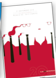
20 ans du club Gier