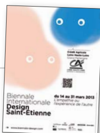
Biennale Design Saint-Étienne