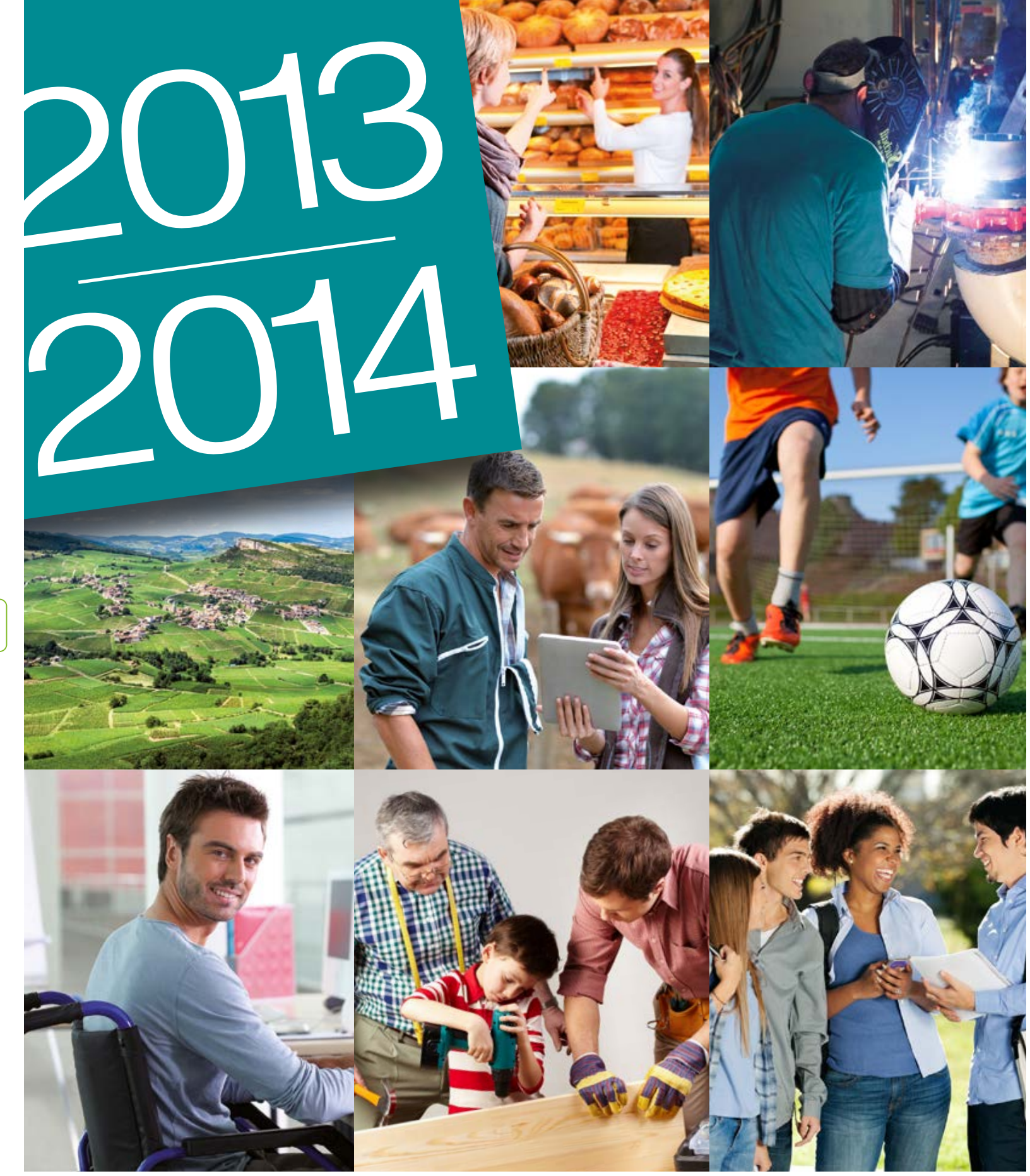
Crédit Agricole Loire Haute-Loire / Pôle CMCP / Communication Externe

Caisse Régionale de Crédit Agricole Mutuel Loire Haute-Loire - Siège Social : 94 rue Bergson - 42000 Saint-Étienne Siret 380 386 854 00018 - APE 651 D - Caisse cotée sur « Euronext Paris », compartiment C PACIFICA, Compagnie d'Assurance dommages, Filiale de Crédit Agricole Assurances. Entreprise régie par le code des assurances. S.A. au capital entièrement libéré de 249 194 475 €. - Siège social : 8/10, Boulevard de Vaugrard 75724 Paris Cedex 15 - 352 358 865 RCS Paris. PREDICA, Compagnie d'Assurances de personnes, Filiale de Crédit Agricole Assurances, société anonyme au capital de 960 754 065 € entièrement libéré, dont le siège social est 50-56 rue de la Procession 75015 Paris - 334 028 123 RCS Paris.