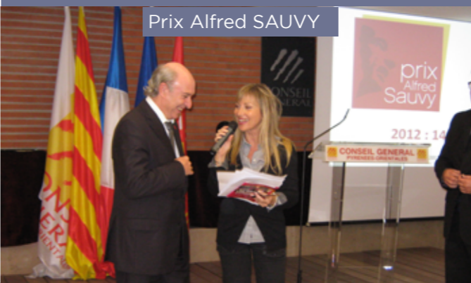
Prix Alfred SAUVY