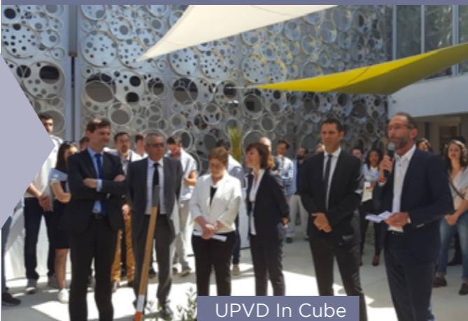
UPVD In Cube