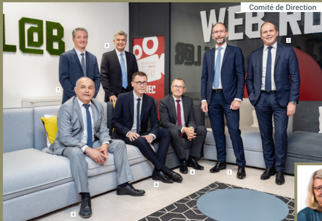
Comité de Direction