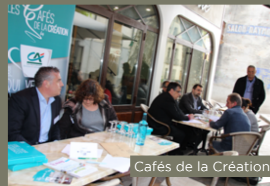
Cafés de la Création

487 administrateurs de Caisse locale œuvrent, chaque jour sur leur territoire, pour réaliser des actions utiles à tous