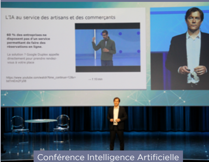
Conférence Intelligence Artificielle