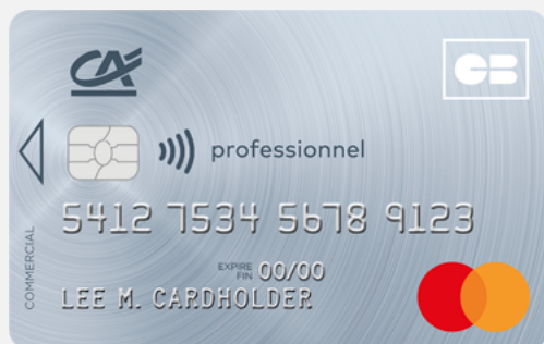
Carte Mastercard Professionnel