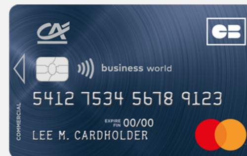
Carte Mastercard Business World*